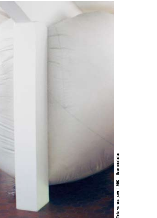
Tonia Kudrass: perly | 2007 | Rauminstallation

WASSERMÜHLE TRITTAU | 27.08. - 25.09.2011