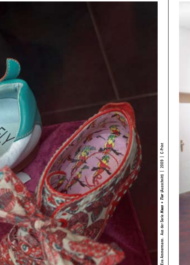
Eva Ammermann: Aus der Serie Haus + Tier (Ausschnitt) | 2009 | C-Print

WASSERMÜHLE TRITTAU | 23.04. - 05.06.2011