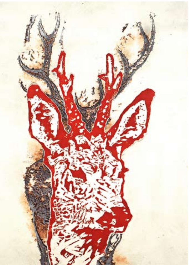
Albert Markert: e. 7 | 2008 | 70 x 100 cm | Holzschnitt (Collage)