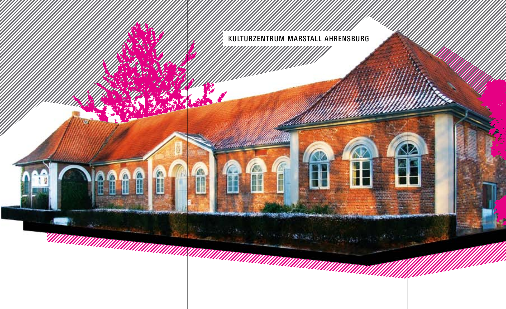
KULTURZENTRUM MARSTALL AHRENSBURG