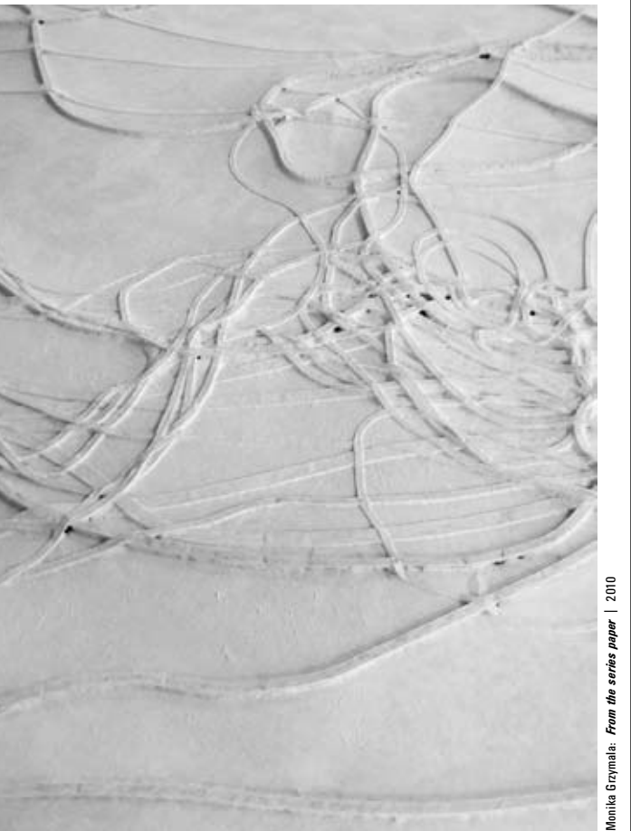
Monika Grzymala: From the series paper | 2010

WASSERMÜHLE TRITTAU | 12.03. - 03.04.2011