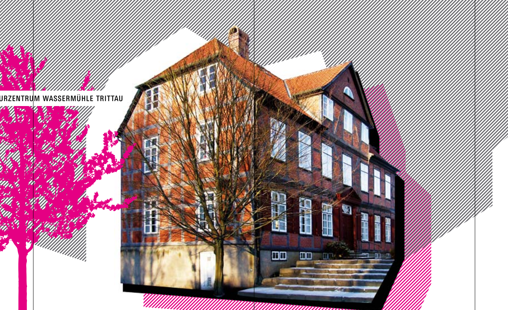
KULTURZENTRUM WASSERMÜHLE TRITTAU