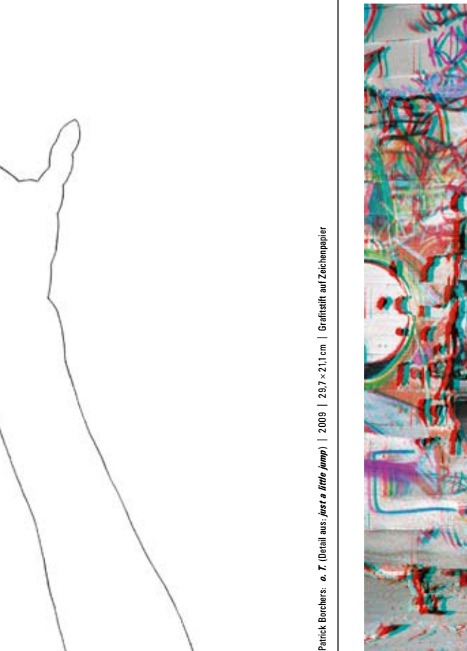
Patrick Borchers: e. 7 (Detail aus Perle + Ringe Pump ) | 2009 | 29,7 x 21,1 cm | Grafisch auf Zuckerpapier