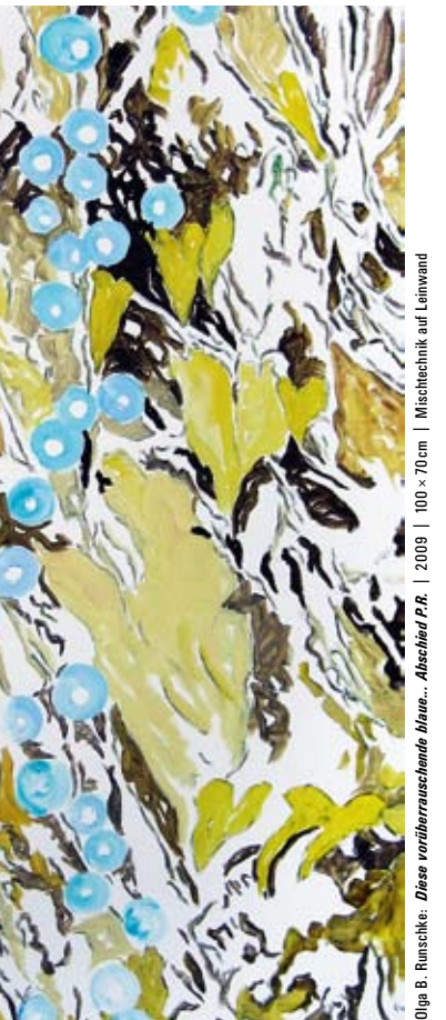
Olga B. Runschke: Diese verwitternsschöne Natur... Abscher PA | 2009 | 100 x 70 cm | Mischtechnik auf Leinwand