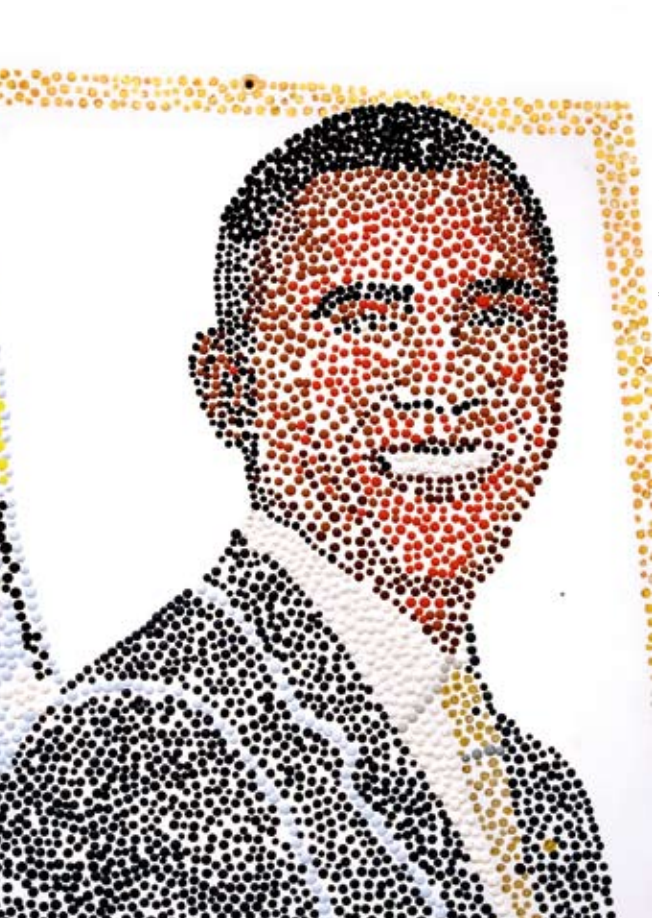
Dieter Vieg: Barek Obama - IN THE WIND... WE CAN CHANGE (Ausschnitt) | 2008 | 150 x 120 x 8 cm | Öl auf Leinwand | Foto: Peter Schäfer

WASSERMÜHLE TRITTAU | 15.01. - 20.02.2011